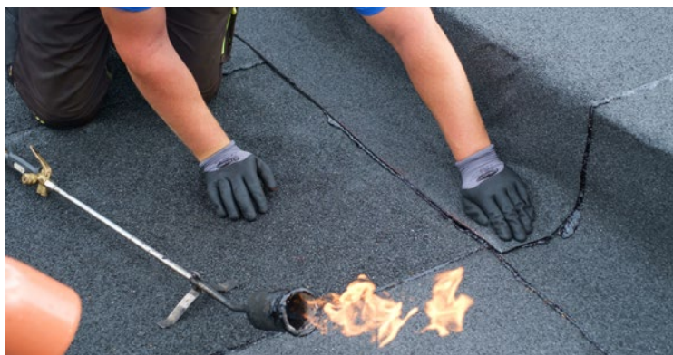
Auch in Detailbereichen mühelos zu verarbeiten.

— Kubidritt Classic — PYE PV200 S5 (DIN) — Mindestanforderung lt. DIN — Leistungsgrenze für intakte Abdichtungen