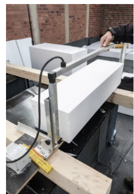
2. Mit der Handsäge oder dem heißen Draht zurechtschneiden